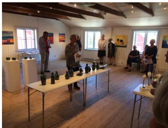
Vernissagen i Grythyttan 1 juli 2018