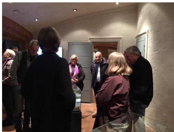
Rundvandring i Måltidens Hus

Dragning gjordes också i lotteriet för värdar/värdinnor som vaktat utställningen under sommaren.